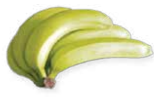
Banano fresco Suiza, Finlandia y Alemania