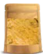
Puré aséptico EE. UU