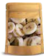
IQF EE. UU